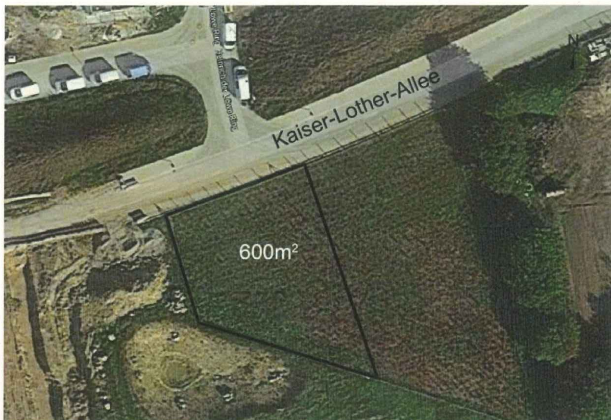
Abb. 1: Artenschutzrechtliche Kompensationsfläche an der Kaiser-Lothar-Allee (Luftbild: Google Earth)

Die Fläche im Geltungsbereich ist mit Sträuchern und Gehölzen zu bepflanzen, so dass eine Kompensation bezüglich der Bäume von mindestens 1:2 erreicht wird. Folgende Arten und Qualitäten sind zu verwenden: