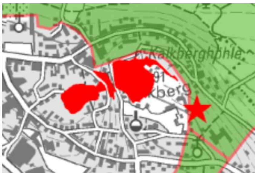
Abb. 2: Ausschnitt Flugkorridore und Funktionsräume (Plan 3, KifL 2022)

Im Konzept zur Erhaltung der Erreichbarkeit der Segeberger Kalkberghöhle aus dem Jahr 2022, welches vom Kieler Institut für Landschaftsökologie (KifL) erstellt wurde, liegt die zu betrachtende Fläche im essenziellen Funktionsraum „Kalkberg bis Großer Segeberger See“, dass als Durchflugs- und Nahrungsraum von den Fledermäusen genutzt wird. Darüber hinaus wird die Fläche als Sammelplatz bei der Abwanderung im Frühling hervorgehoben (vgl. Abb. 2). Im Rahmen stationärer Erfassungen im Jahr 2014 wurden hier besonders starke Aktivitäten festgestellt, die für die herausragende Bedeutung des Gehölzbestandes (Plangebiet) für die Fledermäuse der Kalkberghöhlen sprechen.