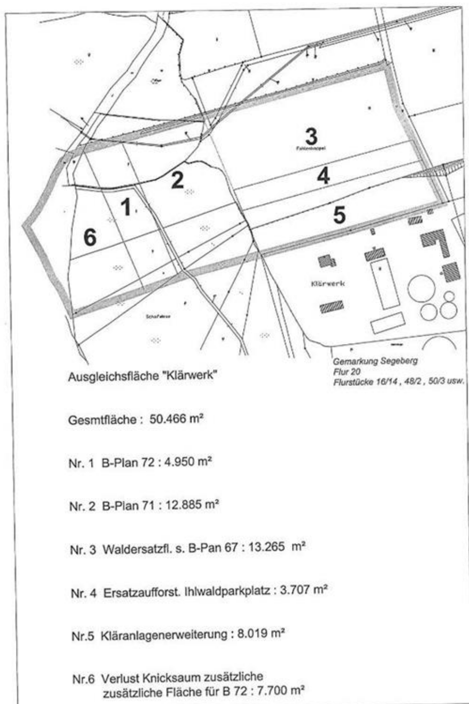
Abb. 3: Übersicht Ökokonto am Klärwerk

Die nachfolgende Abbildung (Abb. 3) zeigt das Ökokonto am Klärwerk mit allen Ausbuchungen. Aus dem Konto wurde damals der Wald im B-Plan Nr. 67 mit 13.265 m 2 /Ökopunkten ausgeglichen. Das Konto wurde in den nachfolgenden Jahren mit 60 m 2 /Ökopunkten überbucht. Diese sollen von der Fläche für den Wald abgezogen werden. Daraus ergeben sich für die Stadt 13.205 m 2 /Ökopunkte an Ausgleichsfläche, die für andere Planungen zur Verfügung stehen.